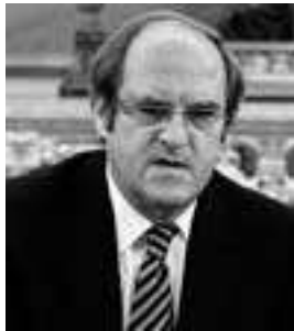
Gabilondo durante una rueda de prensa en septiembre

Hoy en día, la enseñanza obligatoria es hasta los 16 años, es decir, hasta que finaliza la secundaria. Luego se puede cursar voluntariamente el bachi-